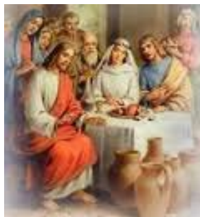
Il segno alle nozze di Cana e la richiesta di Maria.

Nm 20,2.6-13; Sal 94: "Noi crediamo, Signore, alla tua parola". Rm 8,22-27; Gv 2,1-11